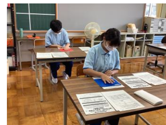
ワーク(書類の折り込み)