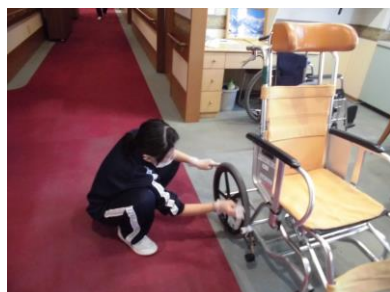
就業体験 1年次から1～5日間行い、 社会自立の基礎を培います。