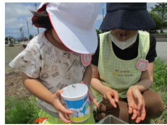
季節の活動 (おたまじゃくし採り)