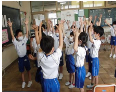
交流及び共同学習 近隣の小学校や富山聴覚総合支援 学校と交流学習を行っています。