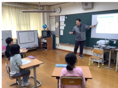
視覚的な支援を用いた 教科指導