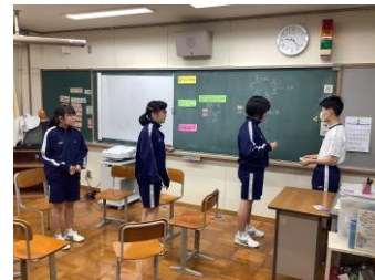
コミュニケーションの学習