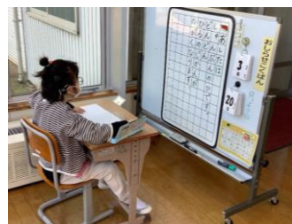
お知らせ黒板を活用した 言語指導