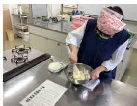
フードデザイン (調理実習)