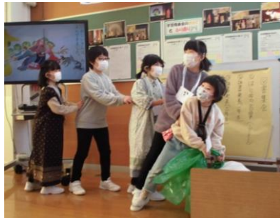
図書集会 読んだ本の内容や感想を 発表します。