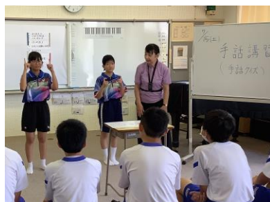
交流及び共同学習 近隣の中学校と富山聴覚総合支援 学校と交流学習を行っています。